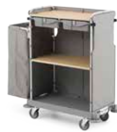
Art. 0000HP4273U 128x55x130 cm