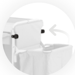
Portasacco pieghevole e ganci di blocco Foldable bag holder and locking hooks