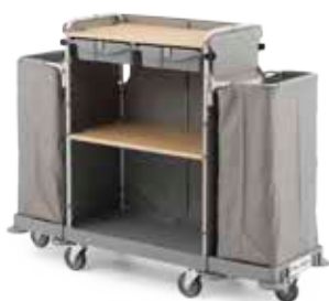
Art. 0000HP4374U 165x55x130 cm