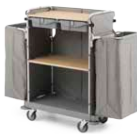
Art. 0000HP4274U 155x55x130 cm