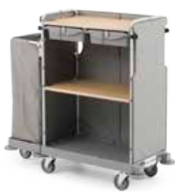
Art. 0000HP4373U 135x55x130 cm